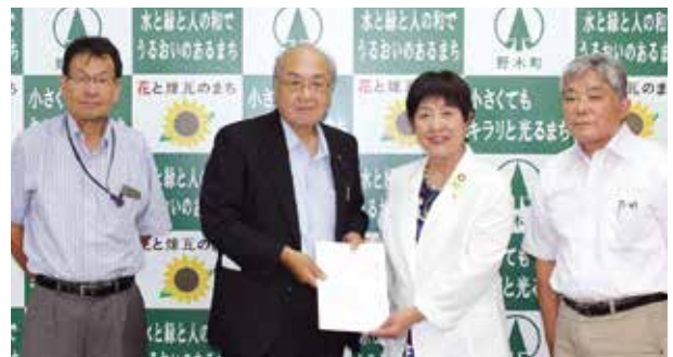
左から針谷理事・眞瀬副会長・眞瀬町長・長谷川常任理事